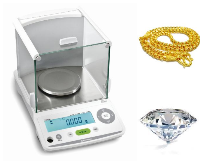
TX 423L / TXC 623L (สำหรับกลุ่มจิวเวลรี มีหน่วย กะรัต)