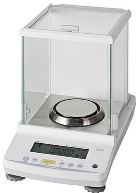
ATY / ATX 224