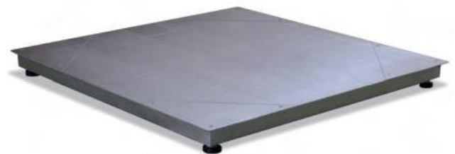
ตัวแท่นจำหน่าย

สามารถเชื่อมต่อกับแท่นสแตนเลสขนาดใหญ่ เพื่อรองรับการใช้งานที่หนักหรือที่เปียกชื้นได้เป็นอย่างดี